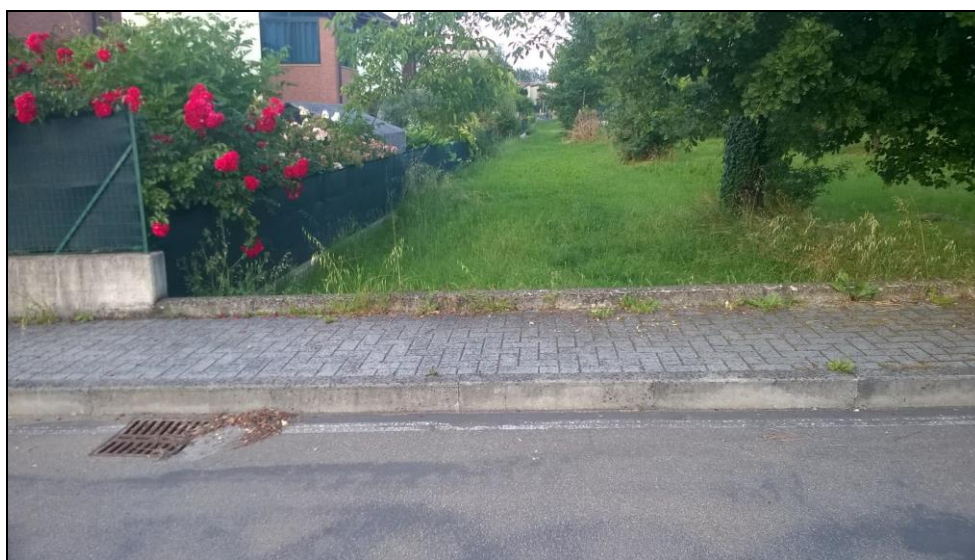
Figura 7 Vista da Via Giovanni Falcone