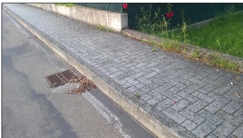
Figura 8 Vista da Via Giovanni Falcone