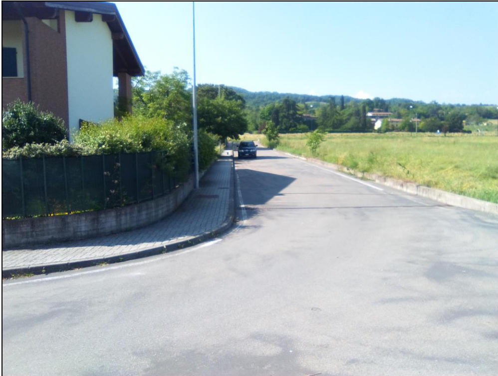
Figura 1 Vista da Via Giovanni Falcone