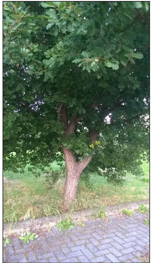
Figura 12 Essenza da abbattere