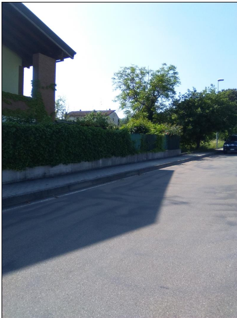
Figura 2 Vista da Via Giovanni Falcone