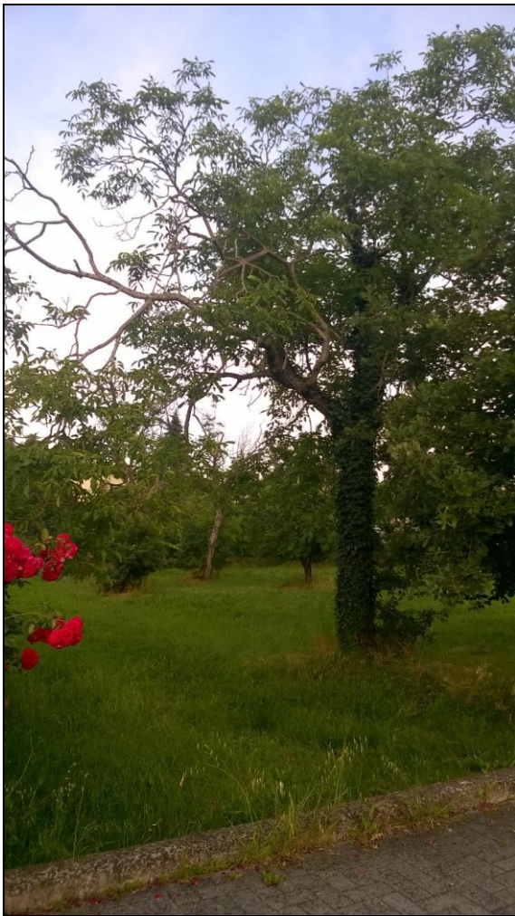
Figura 11 Essenza da abbattere