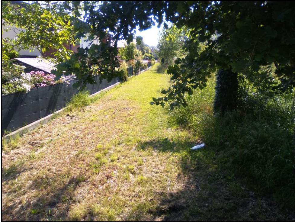
Figura 9 Area in cui sorgerà la nuova strada