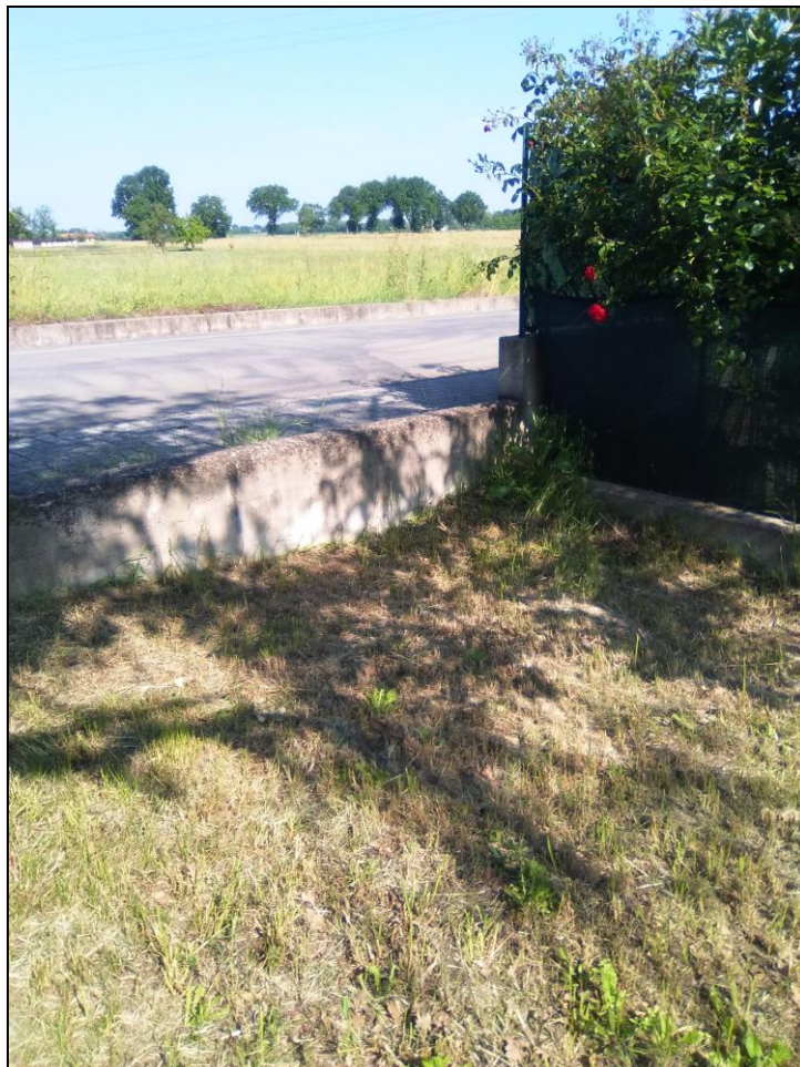
Figura 10 Particolare muretto da demolire