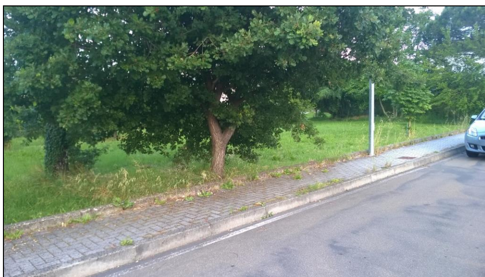
Figura 4 Vista da Via Giovanni Falcone