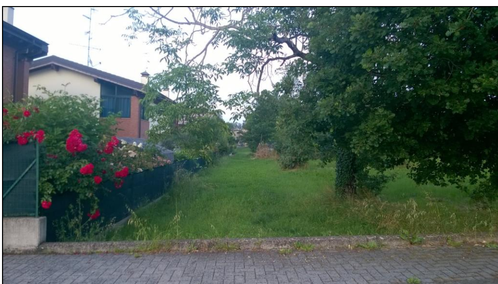
Figura 5 Vista da Via Giovanni Falcone