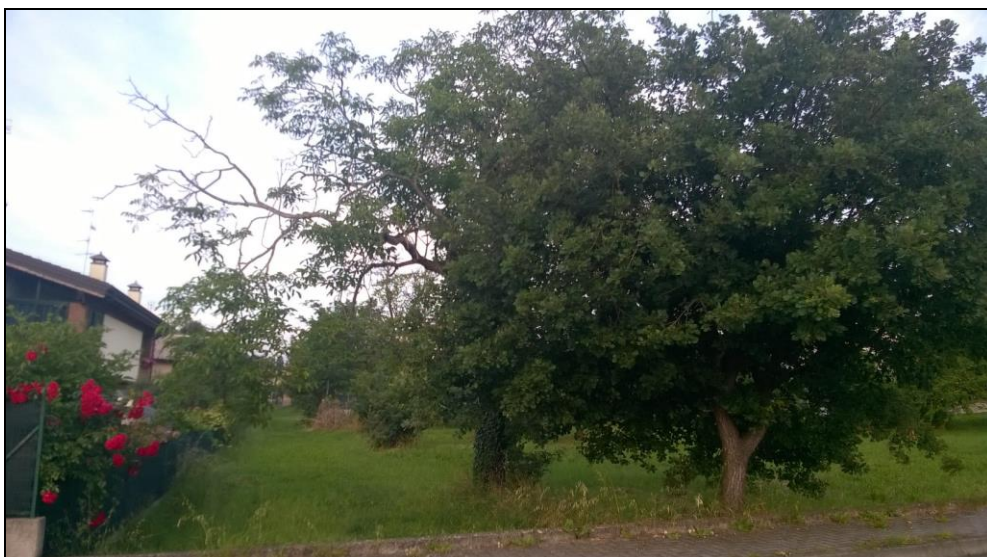
Figura 3 Vista da Via Giovanni Falcone